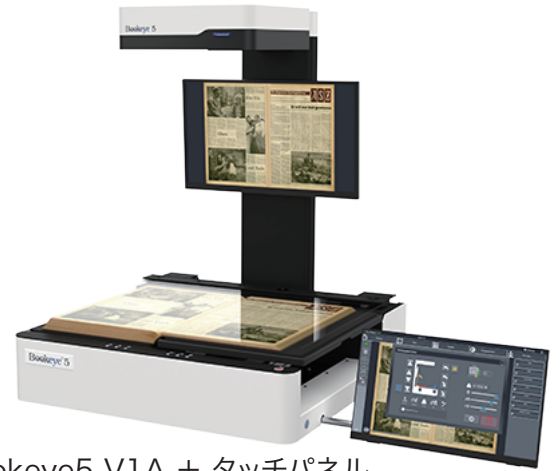
Bookeye5 V1A + タッチパネル