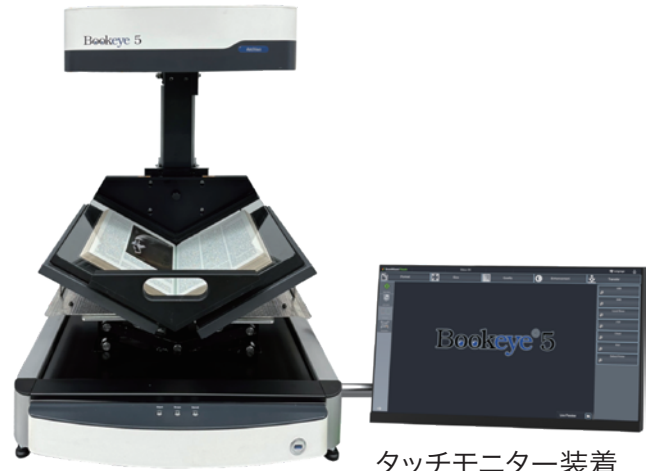
タッチモニター装着