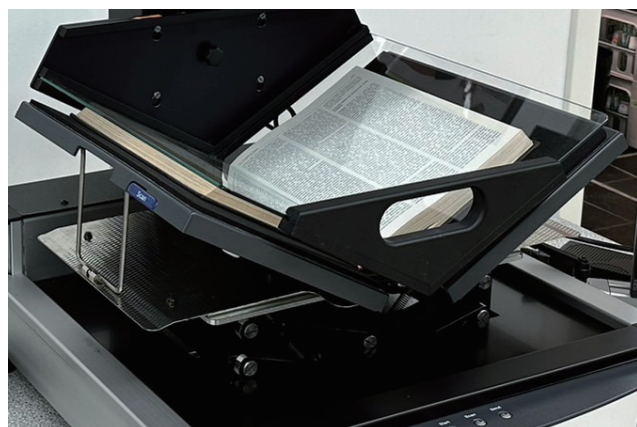
標準装備の V 型ガラスプレート

V ガラスと左右 8cm の厚みを調整する段差解消機能を備えたブッククレイドルの採用により平面性を高めるとともに、これまでどおり古書や貴重書等の本の開閉に負担の少ないスキャンを実現しています。また、オプションでフラットガラスも用意されていますので、様々な種類の原稿も対応可能です。併せて、撮影したデータの一貫性を維持する専用ツール、Batch Scan Wizard が標準で付属します。