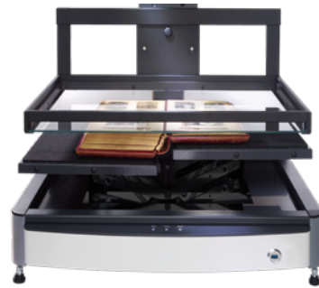
オプションのフラットガラス