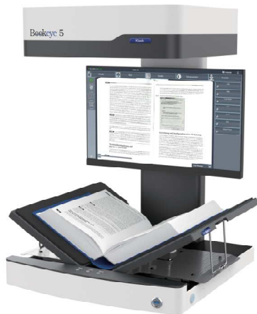
クレイドル:V ポジション