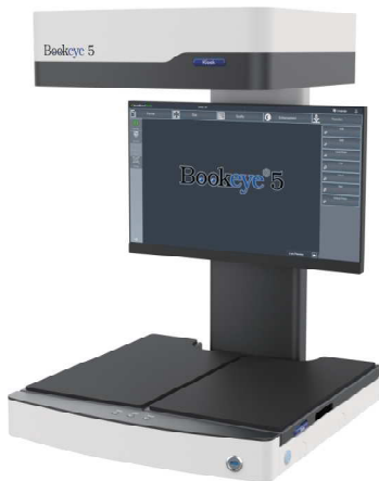
クレイドル:フラットポジション