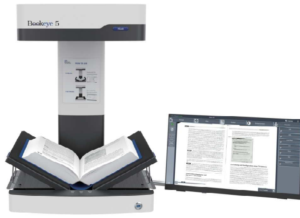
プレビューモニター:横置き