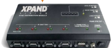
AD1012H Sync Distribution Module